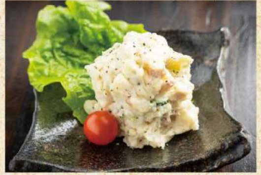
手作りポテトサラダ