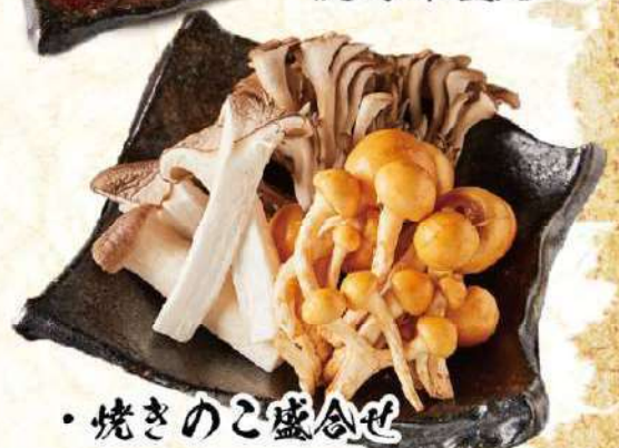
・焼きのこ盛合せ