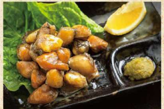
炭火焼きぼんじり