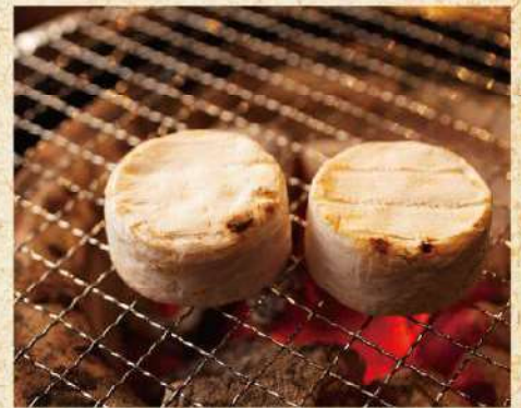
カマンベールチーズ