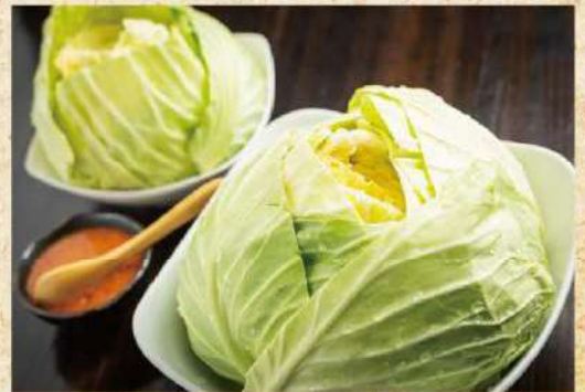
丸ごとキャベツ&ハーフ